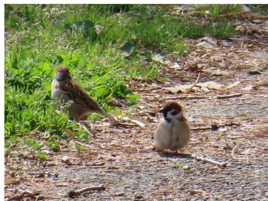
すぐ近くにスズメがいたよ。 よーく見たいから、飛ばないでね。