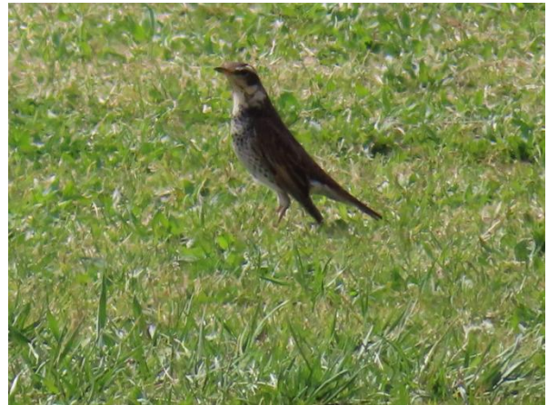
ツグミ発見！ 背筋ピーン、つばさダラ～ン