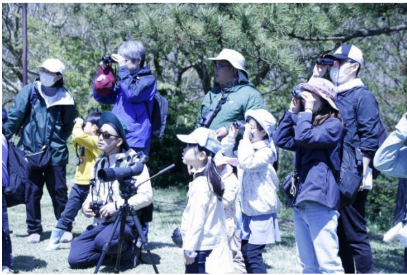
晴天の高清水公園で たくさんの鳥を探しました。