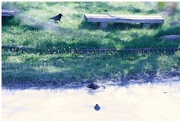
沼には、カルガモが泳いでいたよ。 カラスに気を付けて！