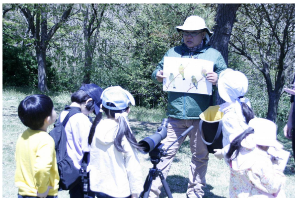
日本野鳥の会秋田県支部の先生が イラストも使いながら、 教えてくれました。