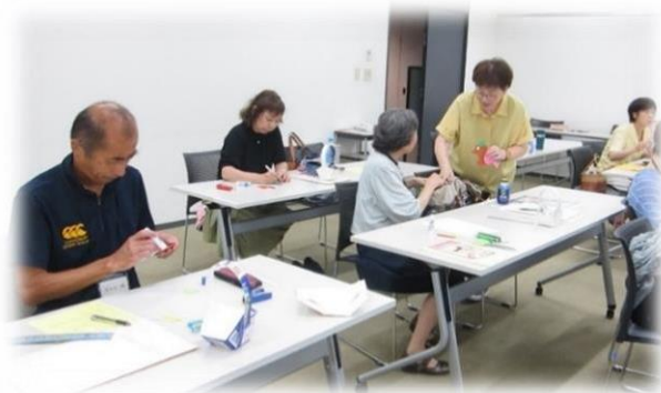
講習「子どもの遊び」