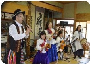
音楽イベントのフォルクローレ演奏 と きりたんぼづくり体験