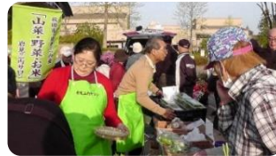
仙台市泉区の「いずみ朝市」販売

里山の魅力を再発見しながら、実家での「地域交流と里山のオアシス」の活動を、夫婦でできる範囲で、無理せずに、楽しみながら、つながりを大切に進めたいと思っています。そして、誰もが心豊かになれるように、小さなつながりと絆を深めていく活動にしていきたいと願っています。