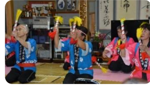
「音楽いべんと」での地元陣太鼓演技の様子