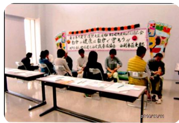
足もみボランティア風景