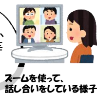
ズームを使って、話し合いをしている様子