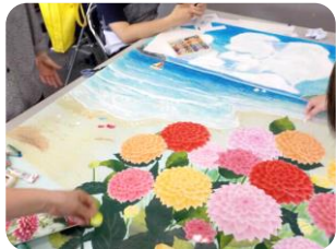
カードゲームは他にも色々あります 生涯学習センター入り口の絵