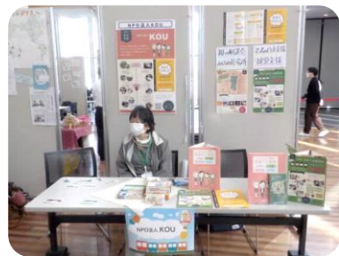
令和2年度フェスタの様子