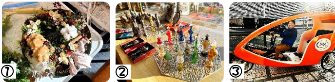
▲ 写真は左から ①「クリスマスリース」完成☆ ②「エジプト雑貨」販売♪ ③「ペロタクシー」に乗ってみよう！！他に、リラクゼーションサロンや片付け・整理収納のお悩み相談コーナー、出展ブースの素敵なグッズが多数ありました！会場は楽しい雰囲気になっていましたよ。