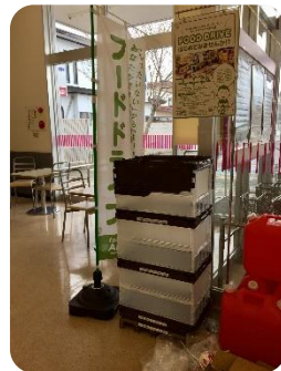
フードドライブボックス