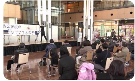
アルヴェでのマジックフェスティバルの様子