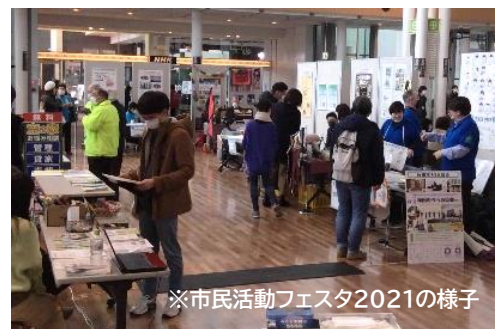
※市民活動フェスタ2021の様子