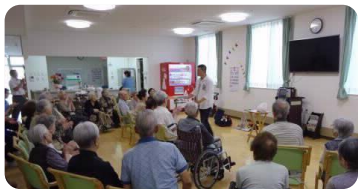
依頼により老人ホームでマジック披露

手品は老若男女が楽しめる演芸です。演じる楽しみ、観る楽しみ、未経験者でも構いません。是非お気軽にご参加ください！また、町内会でのイベント、お祭り、子供会や介護施設などへ出張ボランティア活動をしています。是非、お声かけをお待ちしております。