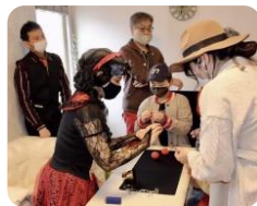
依頼により住宅展示場でマジック披露