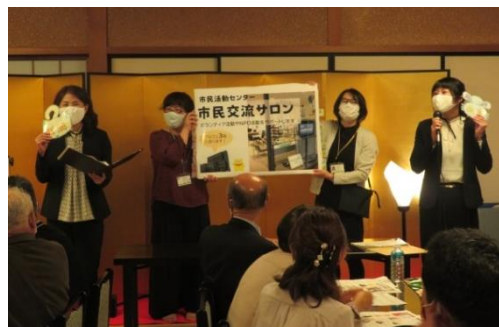
10月18日 市民協働ミーティングの様子

提案としては、「市民交流サロンをもっと魅力的にするためのアイデア」と、「市民交流サロンにキャッチフレーズをつけるとしたら何か」を参加者の皆様に考えていただきました。