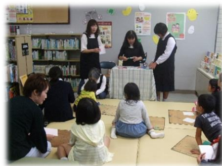
おはなしの会活動の様子

ペープサートやクイズ等も手作りで、キラキラした子どもたち の表情を見るのが何よりの喜びです。 会員同士も楽しく活動しています。