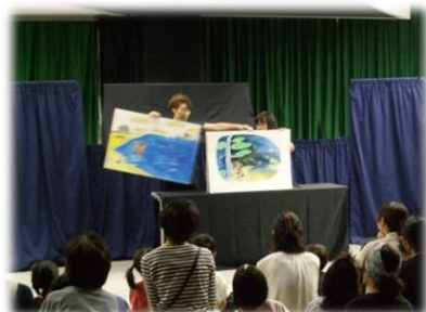
おはなしの会活動の様子

普段本を読まない子どもでも、お話を聞くことによって本に触れる きっかけとなれば…。