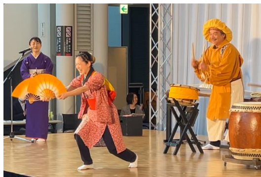
わらび座によるゲストステージ 「秋田音頭」や「秋田大黒舞」など秋田の民俗芸能を披露