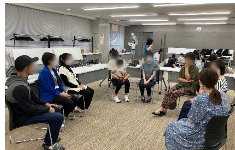
参加者同士の交流の様子

秋田県内に住む、妊娠中～乳幼児の子育て中の家族を対象とした、子育て支援講座を無料で開催しています。外国出身の方も一緒に学べるよう、講師はやさしい日本語を話し、イヤホンガイドを通じた通訳をつけています。また、各講座のテキストは、日本語と母語の翻訳が見開きで見られるように作成しています。