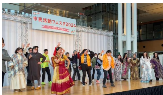
ステージPRの様子 最後は団体の垣根を越えて、迎えたフィナーレ